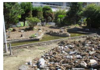
中庭のビオトープ：石や泥が除かれ池の形が分かるようになりました

るように、豊岡南小学校がきれいな学校であるようにと、協力してくださっています。みなさんも、教室や校舎、運動場を大切に使い、丁寧に掃除をしたり、ごみが落ちていたら進んで拾ったり整理整頓をしたりして、歴史と伝統のある豊岡南小学校をずっと大切にしていきましょう。