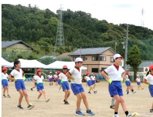
Just keep going☆