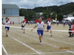
全力で走り抜けた徒競走