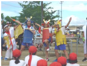
大活躍 ひろせっ子委員

スローガンである「挑戦し はげまし合える ひろせっ子」のもと、子供たちの歓声、保護者・地域の皆様方の温かい応援が運動場に響き渡りました。子供たちの活躍が濃縮された、すばらしい運動会となりました。御参観ありがとうございました。