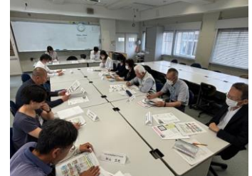
<学校運営協議会の様子>

6月4日（火）に豊岡中学校で行われた学校運営協議会では「今年度の学校経営計画について」「今年度の教育計画・組織編制について」「学校の施設管理・設備等の整備、学校予算の執行計画」等について学校より報告し、委員の皆様から承認をいただきました。